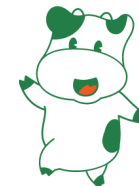
鴨川市 大山千枚田