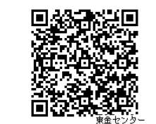
つどい申込みフォーム

行事専用電話は、年末 12/28(金) まで。年始は 1/7(月) よりお受けします。