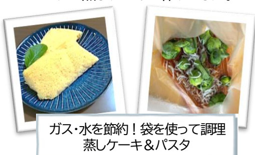
ガス・水を節約!袋を使って調理 蒸しケーキ&パスタ

水は1人分だけでも9日必要なのを知っていますか? 家族分をそろえると、かなりの備蓄が必要になります。 学習会では、少ない資源(ガス・水・食料)を使って パスタと蒸しケーキを作りました。