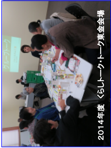
2014年度 くらしトーク・トーク東金会場