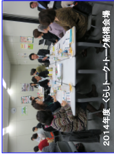
2014年度 くらしトーク・トーク船橋会場

パルシステム千葉の次年度方針案や、日ごろパルシステムを利用して感じてくことなどについて、グループになって意見交換します。美味しいお菓子を試食しながら、楽しくおしゃべりしませんか♪♪ぜひ、ご参加ください！