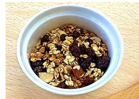
甘酒グラノーラ (イメージ)