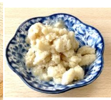
甘酒豆乳アイス (イメージ)