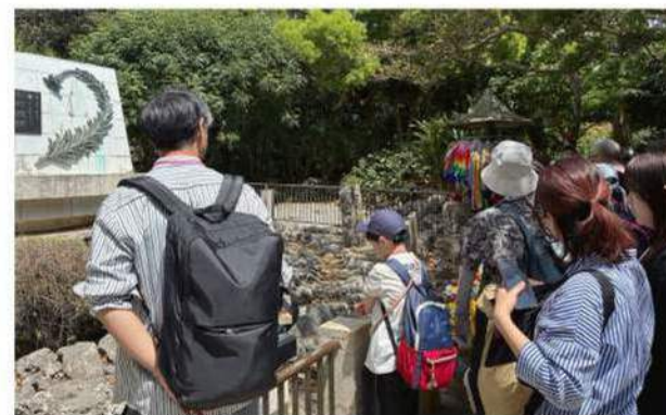
ひめゆり平和祈念資料館

パルシステム千葉では【協同の精神に基づき「平和な社会づくり」に貢献します】を基調とした平和方針を掲げています。方針に基づき一人ひとりの「生きる権利」と「いのちの尊厳」を大切に、笑顔あふれる明るい未来の実現をめざして、多くの市民・団体と一緒に、誰もが尊重される平和な社会を次世代につなげていきます。