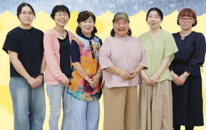
2025年度 パルシステム千葉 商品開発チームの 皆さん