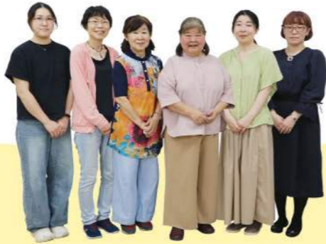
開発チーム「The☆みんなのビスケット」の皆さん

パルシステム千葉の組合員が開発協力した商品が、6月2回ついにデビューしました！ 組合員とメーカー、パルシステムの3者が、何度も話し合いを重ねて作り上げていく「組合員開発協力商品」。子どもから大人まで、みんなに美味しいビスケットをめざして多くの困難を乗り越えて完成しました。その裏側を紹介します。