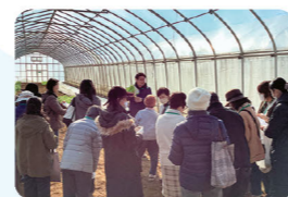
バルグリーンファームのバス視察の様子