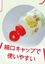
3本セット! たっぷり使える

103918 GMO iNOI フラクトオリゴ糖 700g×3本セット 2,218円 (税込2,395円) 【賞味期間】365日 207kcal/100g 【次回予定】7月3日 ※1日の摂取目安: 15g (小さじ4杯程度)