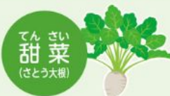
てんさい糖 甜菜 (さとう大根)

日本オリゴの「フラクトオリゴ糖」は国産てんさい糖を発酵させて作られたオリゴ糖です。