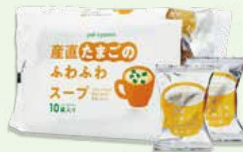
●産直たまごのふわふわスープ 7.5g×1個