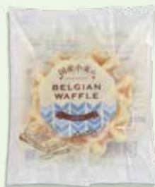
●国産小麦の ベルギーワッフル(バター) ×1個