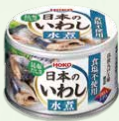
●日本のいわし水煮 130g×1缶