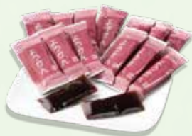
●災害備蓄 塩ようかん ×1本