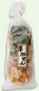
●草加せん(ミックス) ×1袋