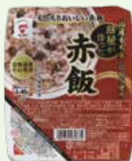
●餅屋が作った赤飯 150g×1個