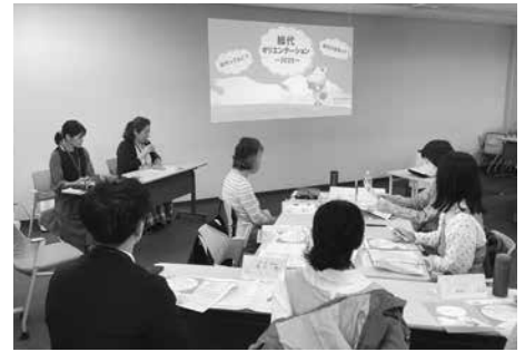
総代オリエンテーション

総代オリエンテーションでは総代の役割への理解促進と総代同士の交流を図り、総代活動への参加につなげました。「くらしトーク・トーク」ではわかりやすい資料や事業・活動全体を紹介した動画を活用した説明、グループトークでの活発な意見交換や丁寧な対応を行うことで、総代の理解と納得性を高める運営につなげることができました。また、第36回通常総代会では合計333名の総代が出席し、すべての議案が可決承認されました。