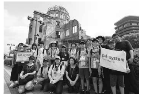
ピースアクション in ヒロシマ

被爆・戦後80年の節目として、ピースアクションへの参加や千葉県生協連と県内の生協が連携した「子どもたちに平和な未来を2025」のほか、「子ども平和新聞プロジェクト」「平和について、知ることからはじめよう！」などの平和活動をととして、平和の尊さや戦争の悲惨さを次世代へ継承することの大切さを学びました。貧困問題では、フードドライブと「買って応援！まごころセット」のほか、社会的養護下で育った若者の支援として募金活動にも取り組みました。環境への取り組みでは、石けんや再生可能エネルギーの学習会を開催し環境問題への意識向上につなげました。そのほか、「福島を考えるフォーラム2026」の開催や募金活動を行い、原発事故を風化させない取り組みを行いました。地域コミュニティづくりは、「居場所づくり」の学習会を開催して交流の場をつくり、コミュニティ活動助成基金の助成団体や自主的活動グループなどのゆるやかな関係性づくりにつなげました。