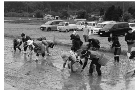
秋田南部圏食と農推進協議会 職員研修

商品学習会や産地研修のほか、階層別研修の実施により各職位における役割の明確化が進んだ一方、管理者のマネジメント力育成には一部課題が残りました。初任給・定期昇給の引き上げや猛暑日手当の支給など、処遇面の改善を進めました。また、在宅勤務や時差出勤、男性育休取得の推進に加え、障がい者や介護部門における特定技能外国人の受け入れなど、多様な人材が活躍できる環境を整備してきました。あわせて、「組織内インターンシップ」 (※) や「おしゃべり会」を実施し、将来のキャリアビジョン形成やコミュニケーションの充実を図る機会としました。雇用定着については、一連の施策により一定の下支えとはなったものの、人員の定着を高い水準で維持・安定させることについては課題が残る結果となりました。