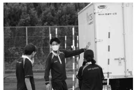
安全運転新人研修

※情報リテラシー…溢れる情報の中から目的に合ったものを主体的に探し出し、その真偽を見極めて適切に取捨選択・活用し、さらに他者に発信・共有する総合的な能力のことです。