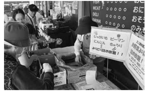
パルシステム千葉 のだ中根店 「野菜の詰め放題」企画

各部門における事業推進の強化、また、人件費や物件費など事業経費が増加する中、抜本的な事業構造の改革協議を進めました。総合福祉の取り組みでは宅配・店舗・夕食宅配・家事支援・介護の各部門で連携しながら推進し、総合福祉の具現化に向けた基盤が整ってきました。