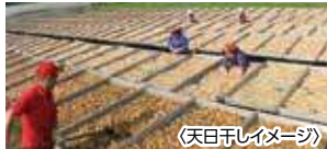
〈天日干しイメージ〉

昔ながらの天日干し製法に70余年こだわっています。 厳選された千葉県産の原料を水洗いして、野外で乾 燥させるこの製法により、うまみ、甘みが増してより 味が凝縮された落花生ができていきます。