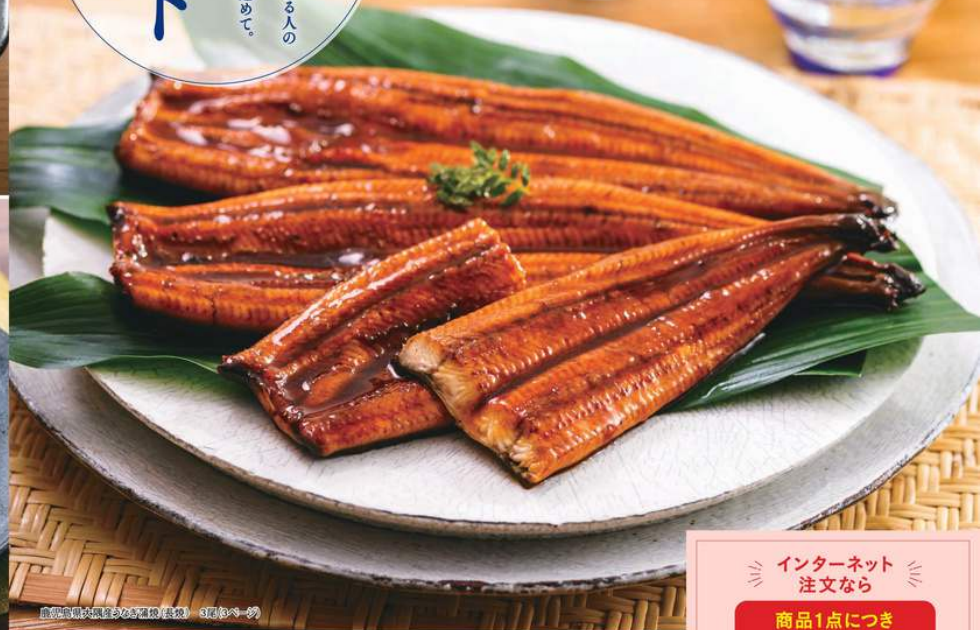
産直信州味増漬(塩麹) 塩麹 9尾(約30g)