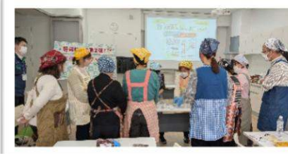
1/28(水) 天使の誘惑クッキー