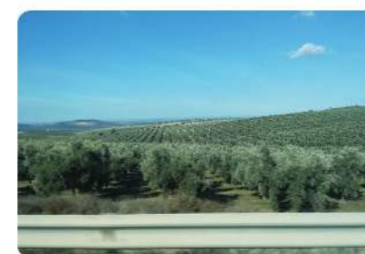
広大なオリーブ畑