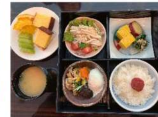
▲昨年の産直ランチ

日時: 3/5(木) 10:00~13:00 会場: ホテルグリーントワー幕張 (千葉市美浜区ひび野2-10-3) 定員: 100名 (組合員またはご家族に限ります) 参加費: 1,000円 (産直ランチ・お土産付き) 〆切: 2/16(月) 正午 保育あり: 15名まで(生後4カ月以上) ※保育費500円⇒チーパス提示で200円 ※応募者全員に2/20(金) までに当落結果をご連絡します。