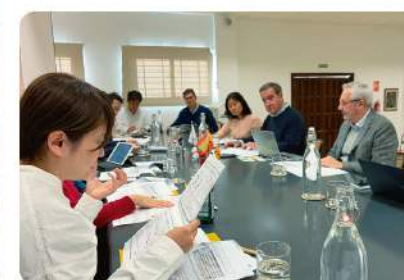
原料生産・製造、販売状況等について意見交換