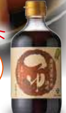
〈ココノエフーズ〉愛媛媛