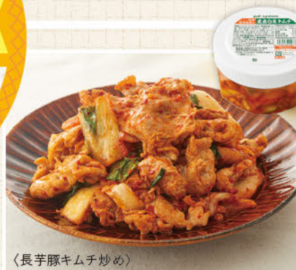
〈長芋豚キムチ炒め〉

200g 特別価格 268円 (税込289円) 5月3回 コトコト・Kinari