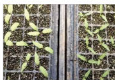
無事に発芽しました! なす(左)とピーマン(右)

【2月実績】●供給高 1,469,146円(予算比55.7%、前年比51.8%) ●供給点数:9,315点(予算比111.7%、前年比116.2%)