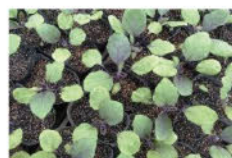
育苗ポットに移して定植できるまで育てます