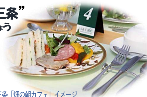
燕三条「畑の朝カフェ」イメージ

いま世界から注目される“燕三条”ブランド。新潟県「燕三条」とオンラインでつながって、その様々な魅力について教えていただきます。パルシステムのカタログで人気の燕三条アイテムについてもご紹介します。