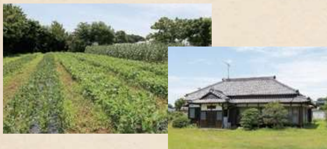
一面に広がる広大な畑。 活動拠点には古民家を 活用しています。