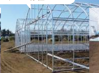
いよいよ植え付け…