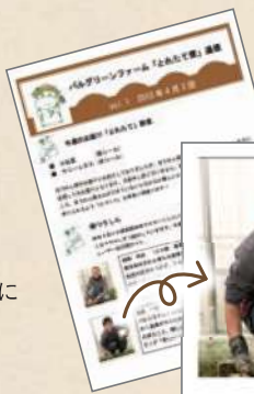
パルグリーンファーム通信第1号