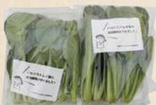
2012年秋には「のだ中根店」に初出荷!