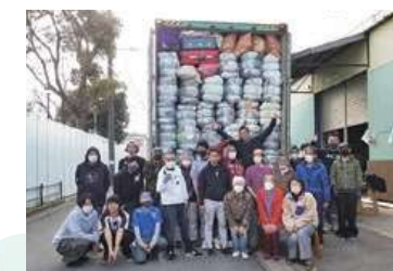
パキスタンに送り出すコンテナ積み込み(約24.7トン)を終えた協力団体とJFSAスタッフの皆さん