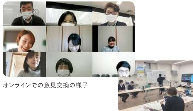
オンラインでの意見交換の様子

『商品開発チーム』は、1年間にわたり、組合員とメーカー、パルシステム連合会の商品担当が、組合員の「あったらいいな」の声をもとに商品の開発協力や改善に取り組む、組合員活動のひとつ。2021年度に商品開発に取り組んだのは、実は2020年度の商品開発のために集まった5名の皆さん。コロナ禍で開発自体が中止となってしまった中、「次年度もぜひ同じメンバーで…!」とリベンジを果たすべく臨みました。