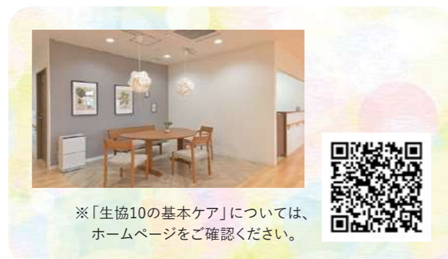
※「生協10の基本ケア」については、ホームページをご確認ください。

また、いきいきと張りのある生活を送っていただくうえで、楽しさや居心地の良さを感じてもらうために、職員の普段の関わりが重要であると考えています。健康や生活面のサポートを受けながら、介護度が進んでも安心して過ごせる第二の我が家となるよう「場所づくり」を進めてまいります。