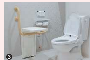
① 備え付けのミニキッチンでは料理も可能 ② 共用の浴室にはリフト浴もあり、安心して入浴していただけます。 ③ 共用トイレには、安定した座位姿勢を保持することができるテーブルを設置