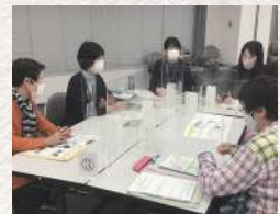
「くらしトーク・トーク」の運営